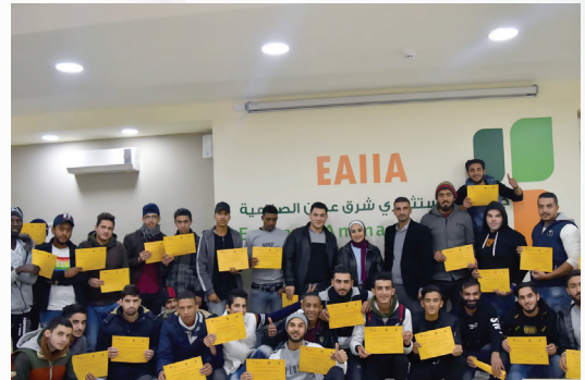
تم عقد 14 دورة تدريبية «مهارات التوظيف الأساسية» للباحثين عن عمل استفاد منها 264 متدرب، ضمن مشروع وحدة دعم التشغيل