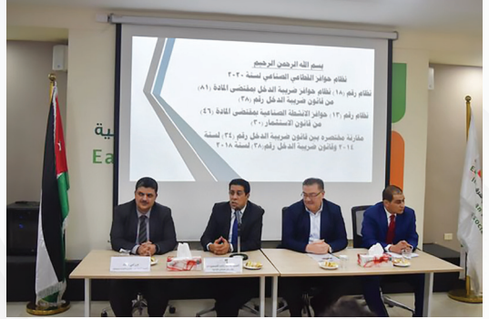
ورشة توعوية وتعريفية حول برنامج دعم الشركات الصناعية لأجل التصدير لأول مرة بالتعاون مع المؤسسة الأردنية لتطوير المشاريع الاقتصادية (JEDCO)