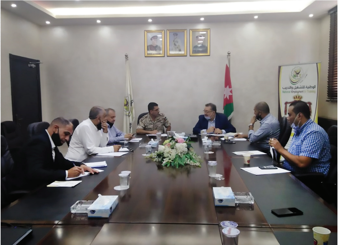
اجتماع المجلس المشترك لإدارة معهد جمعية مستثمري شرق عمان المهني