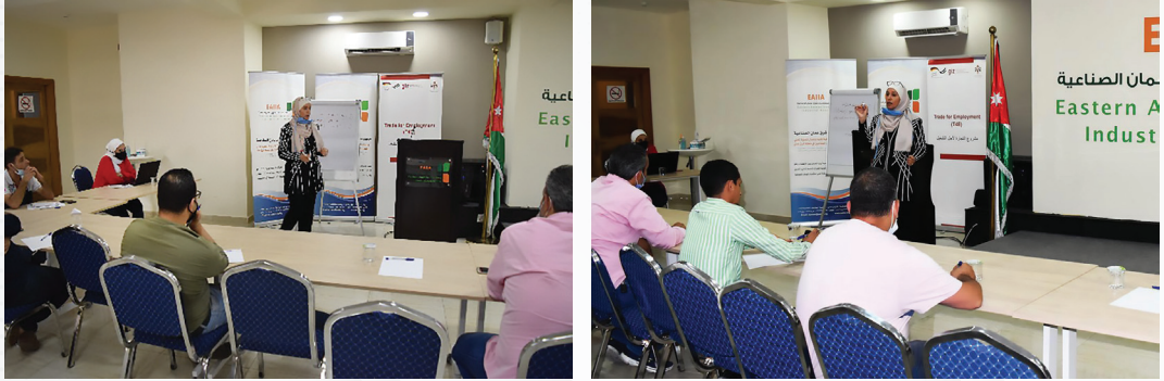
دورة «أساسيات شؤون الموظفين»