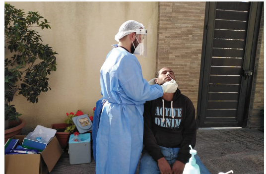
جمعية مستثمري شرق عمان الصناعية ومتصرفية لواء ماركا بالتعاون مع وزارة الصحة، حملة إجراء فحوصات كورونا للعاملين في الشركات الأعضاء