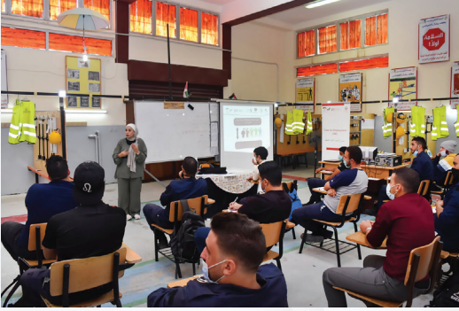
الدليل الإلكتروني لجمعية مستثمري شرق عمان الصناعية