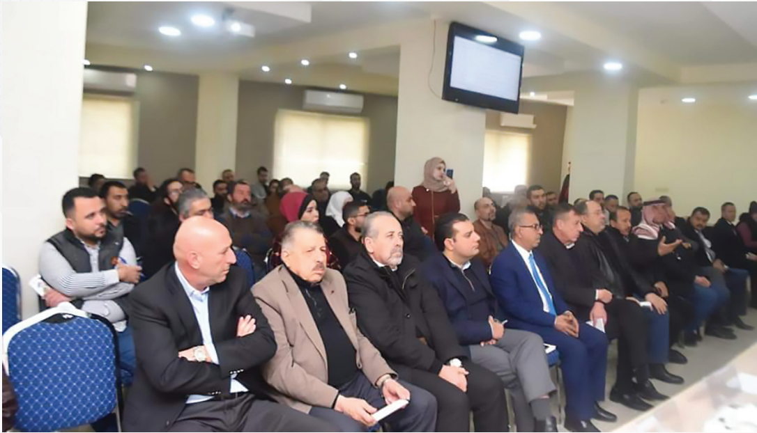
إطلاق برنامج التأمين الصحي الجماعي