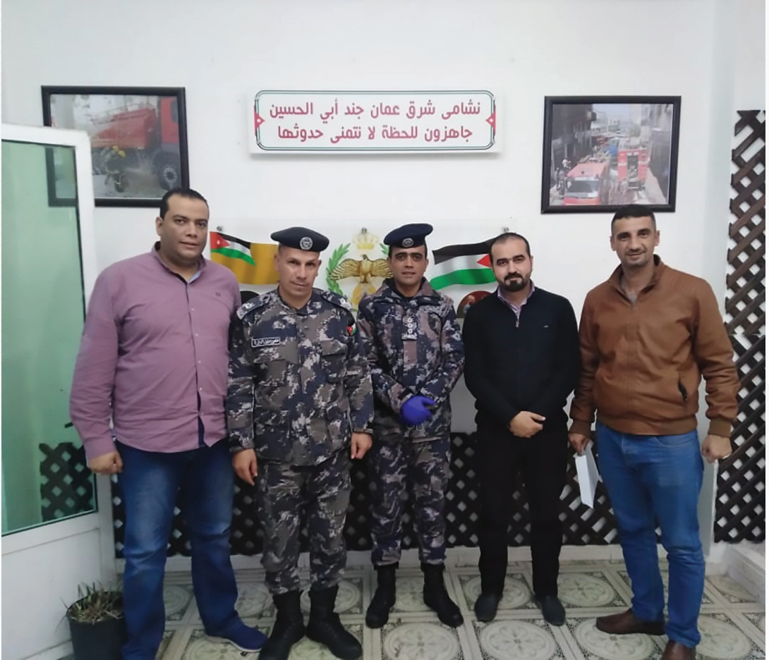
جمعية مستثمري شرق عمان الصناعية تقدم الدعم لمديرية الدفاع المدني لمواجهة جائحة كورونا