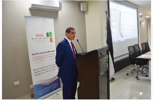
ورشة توعوية وتعريفية وإعطاء شرح تفصيلي لأثر الحوافز الضريبية