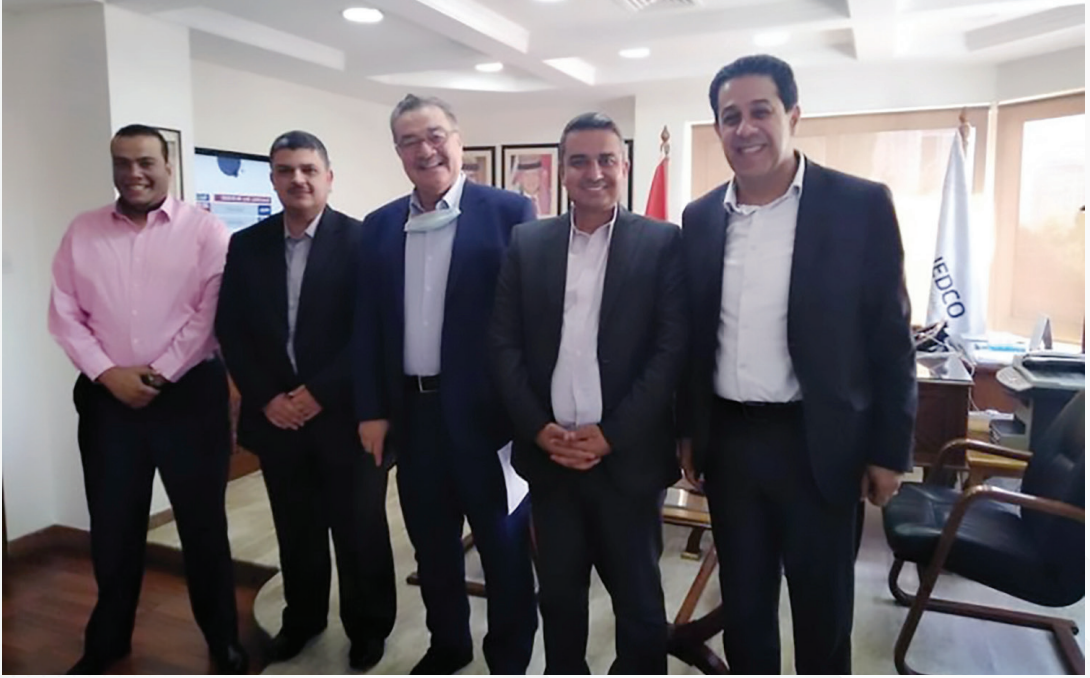
زيارة مجلس إدارة جمعية شرق عمان إلى المؤسسة الأردنية لتطوير المشاريع الاقتصادية (JEDCO)