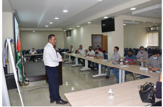
الدورة المتخصصة في ضريبة الدخل والمبيعات