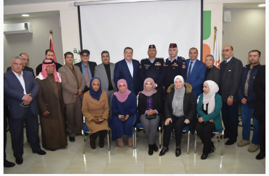
مبادرة توزيع صوبات التدفئة ل 14 مدرسة حكومية في منطقة ماركا الشمالية