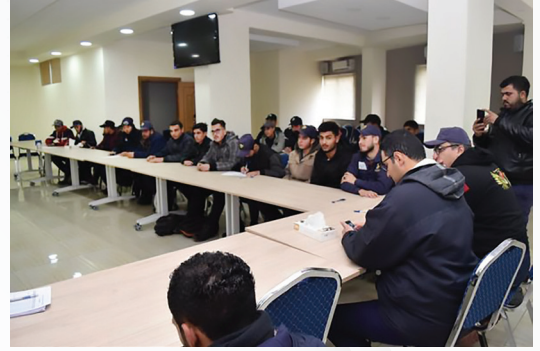
الدليل الإلكتروني لجمعية مستثمري شرق عمان الصناعية