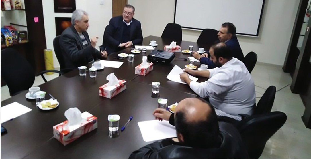
ورشة توعوية بخصوص فايروس كورونا المستجد