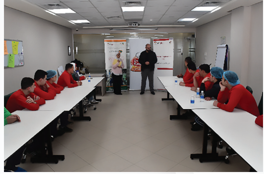
دورة بعنوان «مهارات التوظيف الأساسية» حيث تم عقد التدريب في مقر شركة الكسيح للأطعمة والمنتجات المعلبة