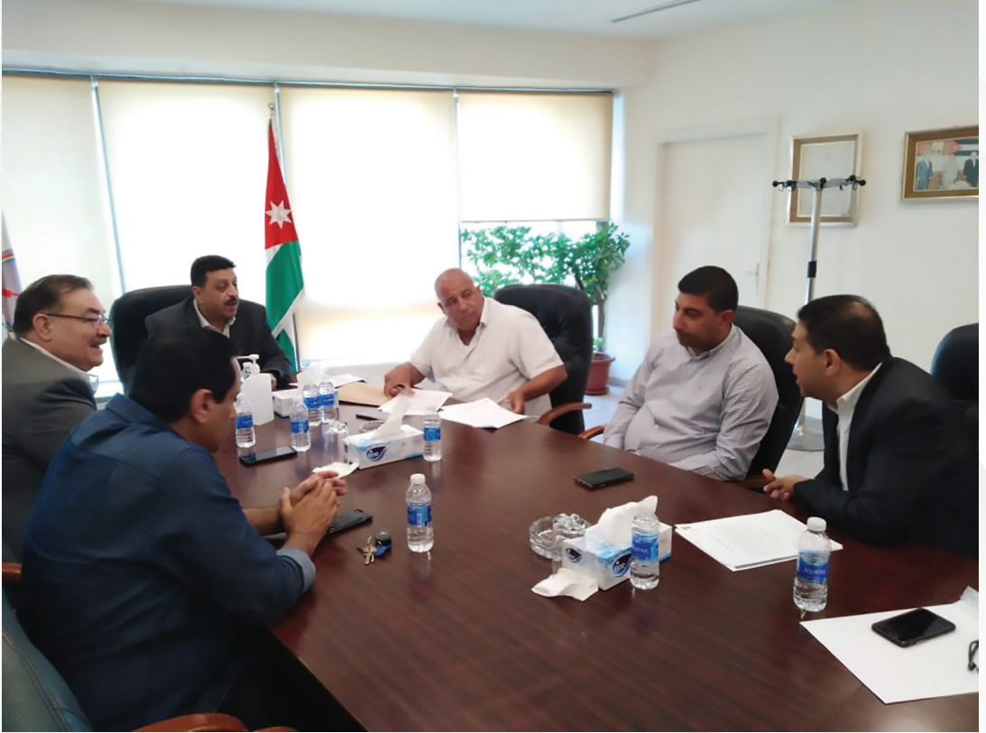
زيارة وفد من جمعية مستثمري شرق عمان الصناعية لشركة الكهرباء الأردنية