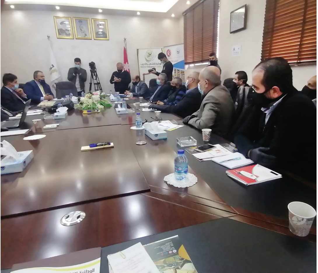
المشاركة في اجتماع الشركات الوطنية لقطاع البناء والإنشاءات في الأردن